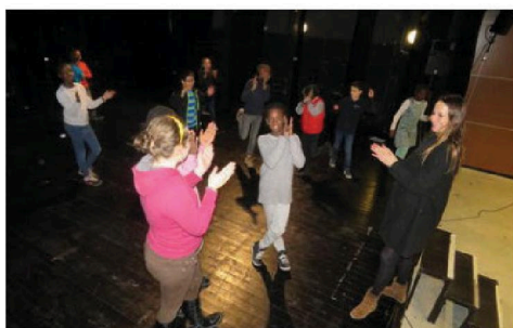
Après le travail de répétition, à la fin de la journée, les comédiens s'applaudissent.